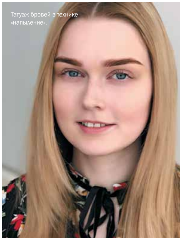
Татуаж бровей в технике «напыление».

— Любите себя, доверяйте профессионалам, и вы однозначно будете выглядеть ухоженно, а это значит, что на вас будет хотеться смотреть, любоваться и брать пример. Будьте в тренде, а я, ваш проводник в мир естественного татуажа, помогу вам почувствовать себя счастливее как можно дольше.