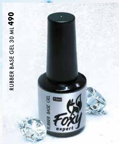
RUBBER BASE GEL 30 ML 490