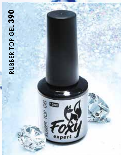
RUBBER TOP GEL 390

Каучуковые базы 15, 30 и 50 мл Каучуковые камуфлирующие базы 15 мл Каучуковые топы, без лс и матовые Праймеры Акрил-гели