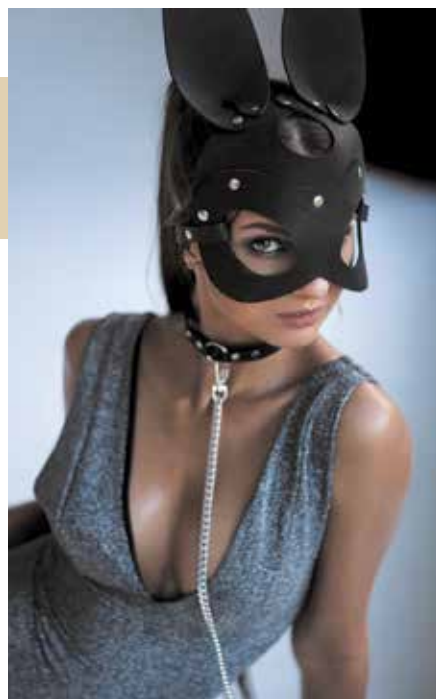
@rog.photo | @risenbird

Ваши изделия — эксклюзив, но, откровенно говоря, они не для всех. Планируете расширять линейку товаров?