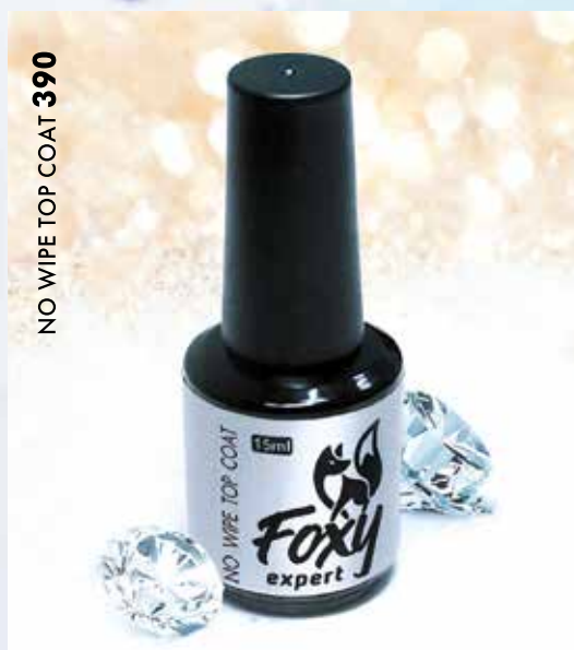
NO WIPE TOP COAT 390