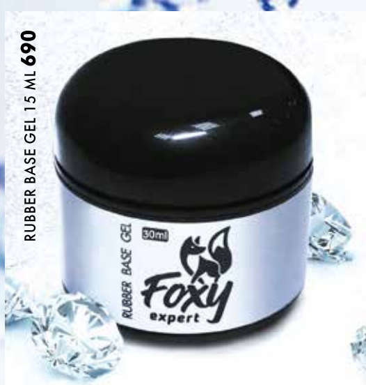
RUBBER BASE GEL 15 ML 690